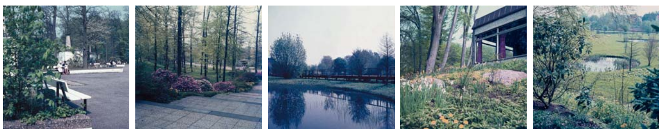
▼ Blicke in den Kurpark v.l.n.r.: Bei den Kaminhäuschen; Treppenanlage am Brahmberg; Steg an der Schwentine; an der Liegehalle; Blick auf die Schwentine-Wiesen Foto: Peter Plomin, um 1970