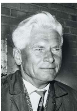
◀ Karl Plomin (1904–1986) Als Angestellter des städtischen Gartenamtes war Karl Plomin maßgeblich für die Planung der 1935 eröffneten »Niederdeutschen Gartenschau« in Hamburg verantwortlich. 1951 gestaltete der inzwischen selbständige Landschaftsarchitekt die erste Bundesgartenschau in Hannover. Im selben Jahr gewann er den ersten Preis im Wettbewerb »Internationale Gartenschau 1953«, die 1953 auf dem Gelände von »Planten un Blomen« in Hamburg präsentiert wurde. Privatbesitz, 1963

Auch die Hochbauten nehmen – den Vorstellungen Plomins folgend – Rücksicht auf den Baumbestand und die natürliche Beschaffenheit des Geländes. Um Trockenlegungen und Planierungen zu vermeiden, wurden die Bauten auf dem sumpfigen und unebenen Untergrund aufgeständert. Die eingeschossige Liegehalle erstreckt sich über dem nach Süden steil abfallenden Terrain. Eine breite Galerie bietet Platz für ein Sonnenbad bei gleichzeitigem Ausblick in den Park. Ein nahe am Gebäude stehender Baum konnte durch einen Rücksprung der Galerie erhalten werden. Am 26. April 2008 wurde der Kurpark feierlich wiedereröffnet.