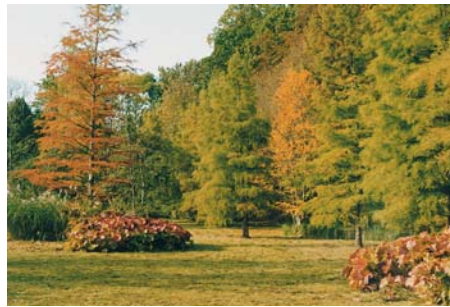
▲ Blick in die Schwentine-Wiesen mit Sumpfyzypressen